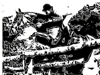
Гладстон (Gladston) от Gotz'a и дочери Weingau под Х. Симоном успешно выступал в национальных и интернациональных турнирах