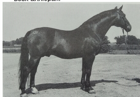
Вайнгау (Weingau), 1954 г.р. от Weiler'a. Отец Валерика.

Для представителей этой линии характерны: крупный рост, богатая мускулатура, костистость, грубоватая шея, короткая и прочная спина, мощный круп, косое длинное плечо. В 50-е гг. они представляли собой тип сильной сельскохозяйственной лошади. И в настоящее время их отличает мощь, но вместе с тем они гармоничны, благородны, имеют хороший темперамент и продуктивные, эластичные движения на всех аллюрах.