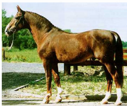
Гранде (Grande), 1958 г.р. от Graf'a

Представители линии Готтхарда унаследовали от родоначальника крупный рост, мощь и вместе с тем легкость, сочетающуюся с крепостью и сухостью конституции. Они красивы, гармоничны, благородны, обладают прекрасными ритмичными движениями на всех аллюрах и способностью к прыжкам.