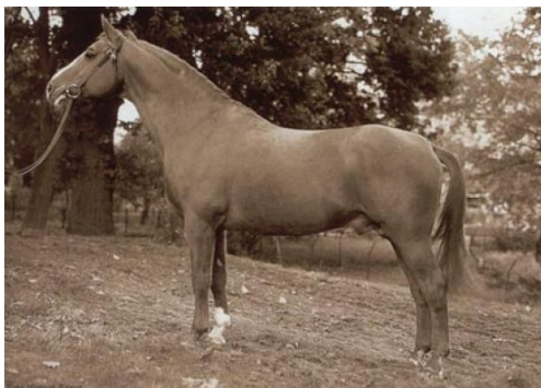
Абзатц (Absatz) , 164, от Абглянца, трк. Использовался с 1964 г. на протяжении 18-ти лет.

Наибольшего заводского успеха Абглянц достиг во время 11-ти летнего использования в Йорке. Именно там были получены его основные продолжатели: Абханг (Abhang) I, II и III, Артур (Artur) и Абзатц (Absatz). Последний стал основателем довольно распространённой линии. У Абзатца очень хорошая голова, холка, широкое плечо, глубокая грудь, несколько коротковат круп; передние ноги легковаты и недостаточно выражены скакательные суставы, но прочное копыто. В целом яркий жеребец. Он в числе лучших производителей ганноверского коннозаводства: 488 его потомков зарегистрированы в спорте с суммой выигрыша 584,4 тыс. DM.