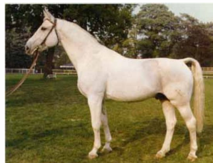
Готтхард (Gotthard), 1949 г.р. от Goldfisch'a II

Представители линии Готтхарда унаследовали от родоначальника крупный рост, мощь и вместе с тем легкость, сочетающуюся с крепостью и сухостью конституции. Они красивы, гармоничны, благородны, обладают прекрасными ритмичными движениями на всех аллюрах и способностью к прыжкам.