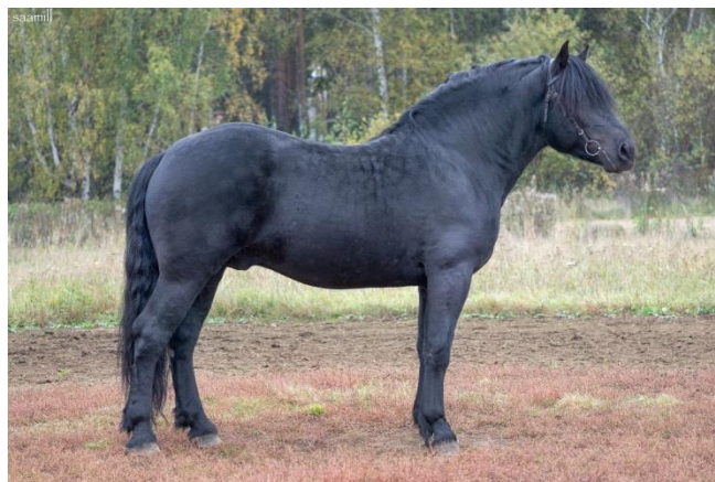
Рис. 2 – укрупненный тип русской тяжеловозной породы

В породе выделено два своеобразных внутripородных типа – это укрупненный (вологодский) и уральский (классический) тип русского тяжеловоза. Укрупненный тип русского тяжеловоза образовался в Вологодском конзаводе при более благоприятных климатических условиях, лучшем кормлении и при использовании кросса двух крупнорослых линий Градуса и Свиста. Это крупные лошади (высота в холке отдельных жеребцов достигает 163 см), часто имеют укороченный формат, многие представители имеют грубую голову (рисунок 2).