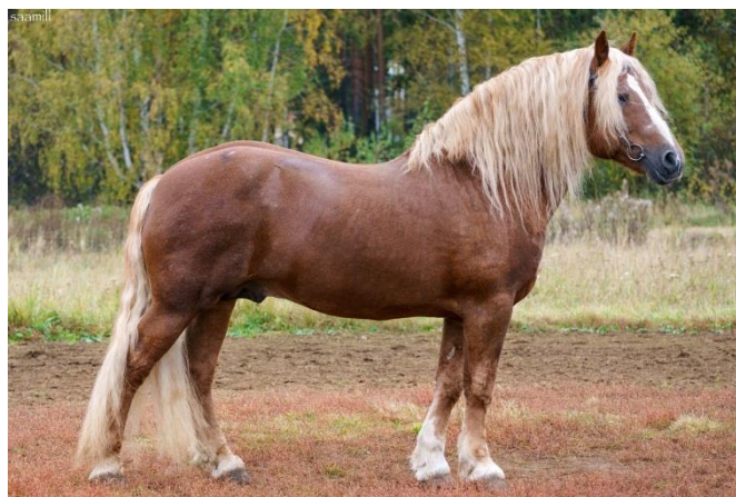
Рис. 3 – классический (уральский) тип русской тяжеловозной породы